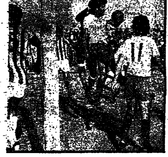
לחץ כבד של חלוצי נתניה בסיום לא פתח את הפועל בית"ר (0:1) על השדה לאומי.

הפועל תל אביב ניצחה את מכבי תל אביב 1:2.